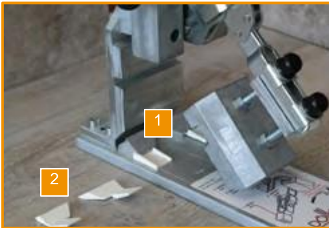
1 Aufnahmen für die Stützböcke Slots for the supporting trestle

technische Information technical information