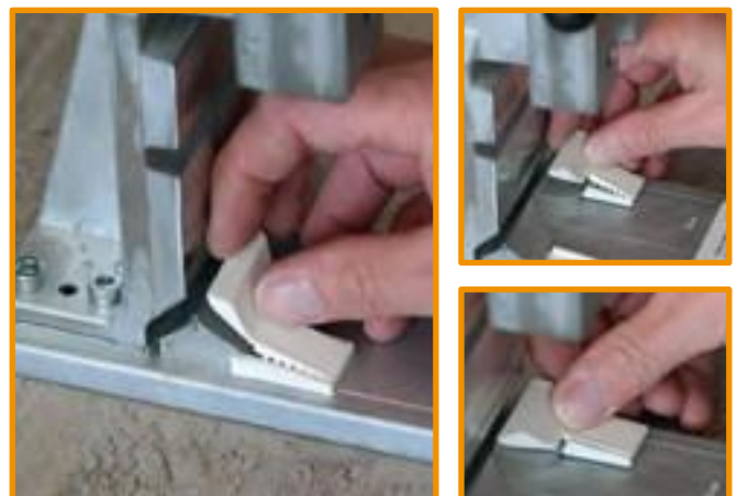
4 Stützböcke in die Aufnahmen einlegen und andrücken supporting trestle insert into the slots and press on