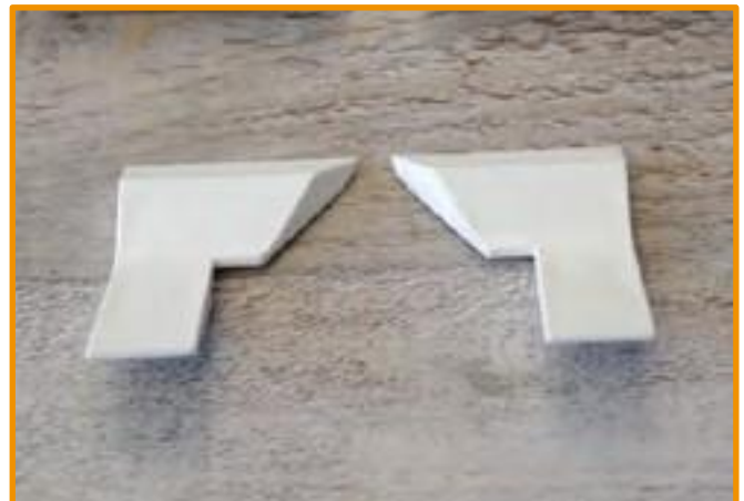
2 Stützböcke - links und rechts supporting trestle - left- and right side