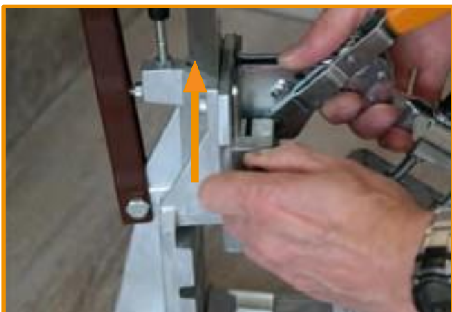
3 Spannhebel herausziehen pull out clamping device