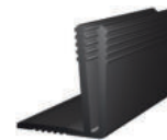
Trägerprofil E2 (Höhe: 14-22 mm)