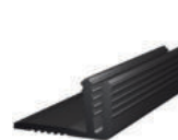
Trägerprofil E1 (Höhe: 9-15 mm)